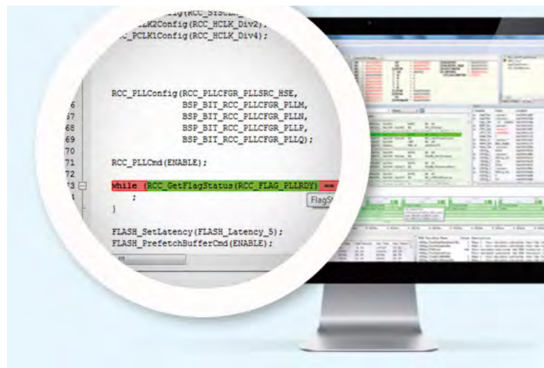
図2：IARの動的解析 (C-RUN) ツールの画面例。