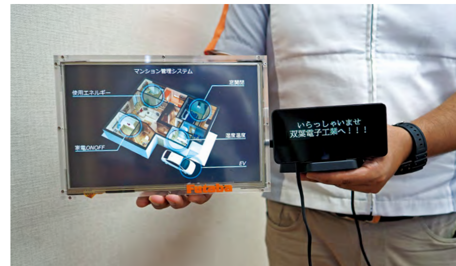
図1：双葉電子が開発した液晶モジュール（デモ機）（左）とVFDモジュール（右）の外観。

NXP社、Cypress社などのARMマイコンを採用しました。コストや使い勝手を考慮して、マイコン・ベンダーを切り替えるようになりました。